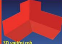
3D vnitřní roh