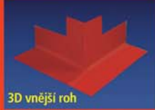
3D vnější roh